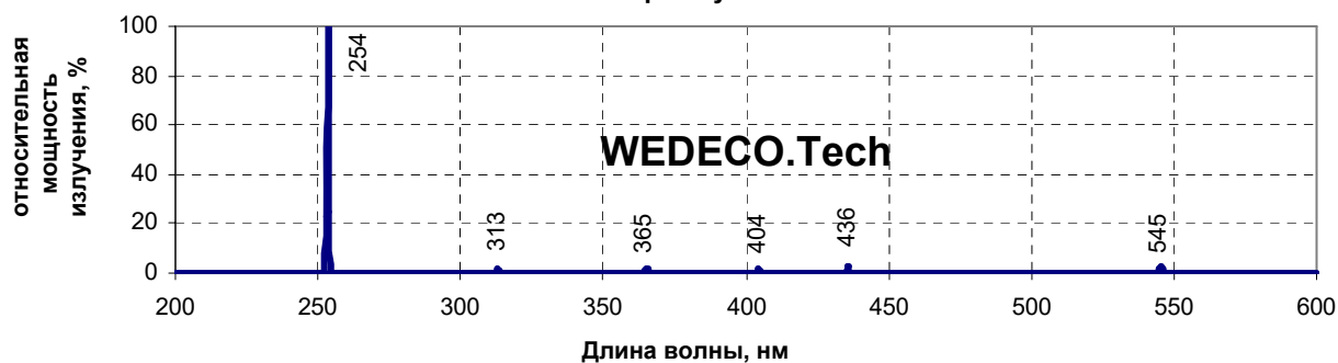
Спектр излучения лампы